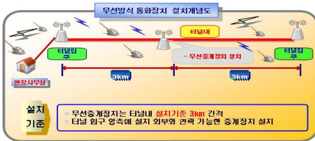
[그림3-2] 무선방식 통화장치 설치 개념도