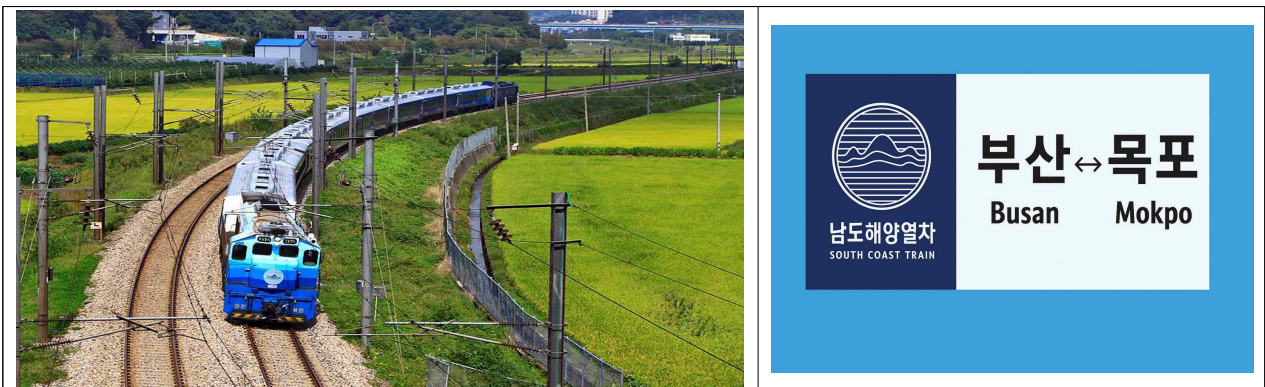
△ 남도해양 관광열차(S-train)