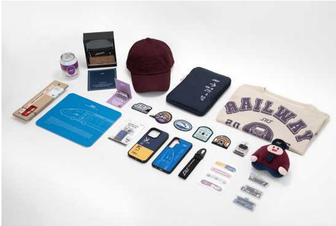
△ 'SRT 굿즈 2025 여름 에디션' 17종